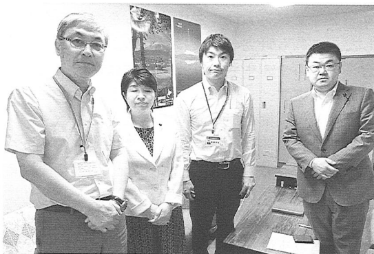
自民党議員との懇談を終えて

6月16日～18日、「ゆきとどいた教育をすすめる北海道連絡会」の事務局（道教組・高教組）で