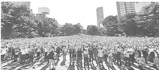
参加者によるメッセージボード・アピール

集会後、大通公園から三越前、すすきのを歩いて、終点中島公園までアピールデモをしました。