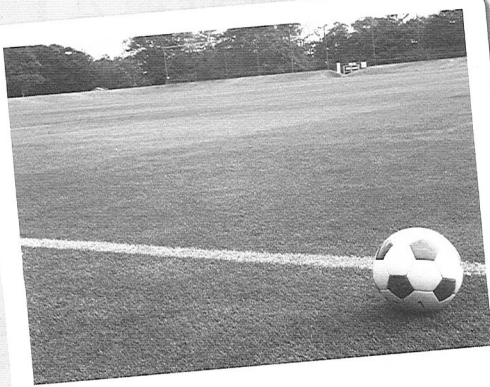
「グラウンド『トルナーレ』」

“とっておき”の写真・絵・短歌・川柳など紙面で紹介できる作品募集。頁下メールアドレスへご連絡を。