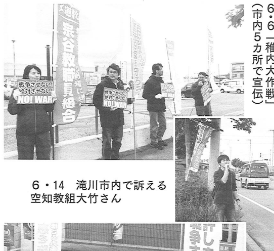
6・6 「稚内大作戦」 (市内5カ所で宣伝)