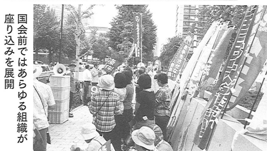
国会前ではあらゆる組織が座り込みを展開