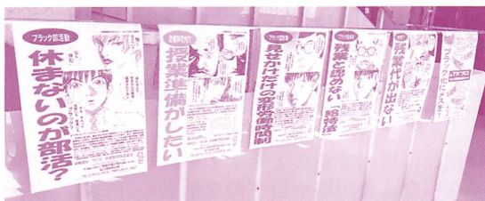
会場に掲示されたTKプロジェクトのポスター