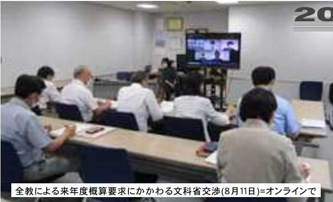
全教による来年度概算要求にかかわる文科省交渉(8月11日)=オンラインで

〒043-0056 江差町字陣屋町 86-1 Tel 0139(52)0858 FAX(52)1490 発行責任者 白山 尚 E-mail: hiyamakyoso@proof.ocn.ne.jp