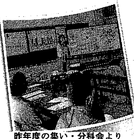
昨年度の集い・分科会より